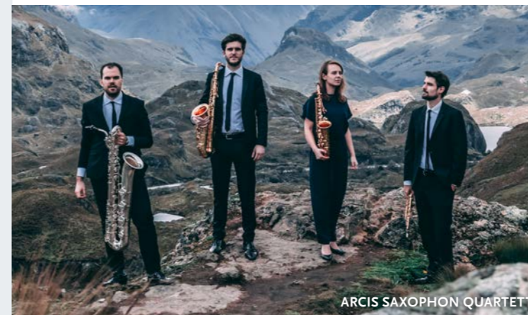
ARCIS SAXOPHON QUARTETT

Die Mission des Arcis Saxophon Quartetts ist es, Musik aus globaler Perspektive zu kreieren, modern zu präsentieren und zugänglich zu machen, um die Bedeutung von Kunst als ein sinnstiftendes Element für das menschliche Zusammenleben in der heutigen Gesellschaft begreiflich zu machen und das Verständnis dafür zu fördern. Im Zentrum steht das Saxophonquartett als eine einzigartige und frische Stimme in der Welt der klassischen Musik. Das Quartett ist frei von jeglichem Schubladen-Denken, es lädt zu Experiment und interdisziplinärer Zusammenarbeit ein.